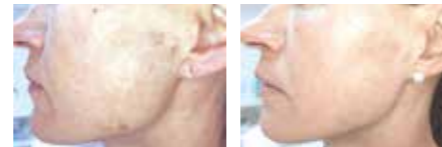
Entfernung von Pigmentflecken