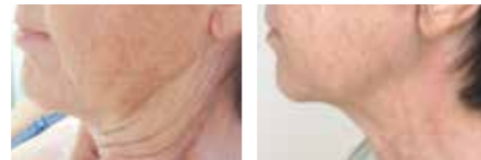
Seitenlift mit Halsstraffung